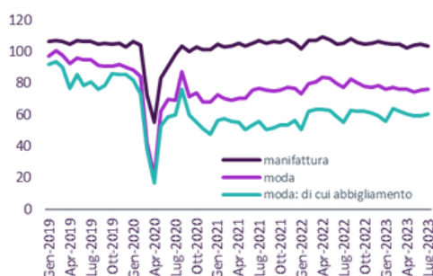
Indice del volume della produzione (dati mensili destagionalizzati, base 2015=100)

Nel primi sette mesi del 2023, il volume della produzione delle industrie del tessile, abbigliamento, pelli e accessori ha registrato una flessione del -4,8% rispetto allo stesso periodo dello scorso anno. A livello di comparti, si osservano tuttavia delle eterogeneità, con l'abbigliamento che ha segnato un leggero incremento tendenziale (+1,6%) . In generale, la dinamica negativa sta risentendo del raffreddamento del ciclo manifatturiero, che riflette a sua volta sia un calo fisiologico dopo la forte ripresa post-Covid sia la perdita del potere d'acquisto dei consumatori causato dall'inflazione elevata. In termini di prospettive nel breve termine, il clima di fiducia delle imprese della Moda è risultato in lieve deterioramento, per i timori di un ulteriore indebolimento della domanda nazionale e estera.